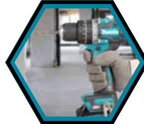
Kompaktes und leichtes Design