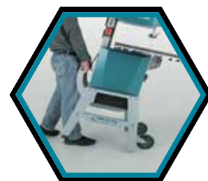
Grosse Räder, um die Maschine zu bewegen.