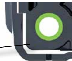
Struktur zur Stossdämpfung