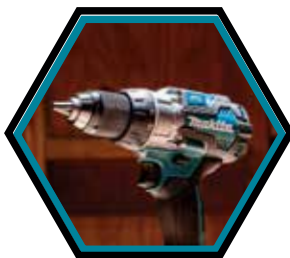
Schnellspannfutter aus Metall.