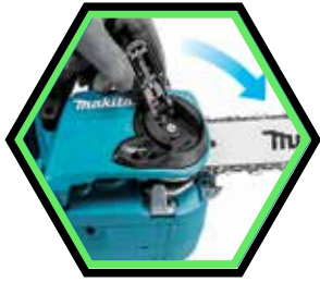
Kettenwechsel und Kette Anziehen ohne Werkzeug.