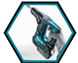
Kompakte, ergonomische und leichte Maschine.