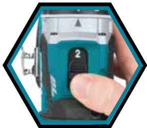
2-Gang-Getriebe mit Schlag.

Geliefert mit 2x Akkus 5.0 Ah, Schnellladegerät und Makpac-B Transportkoffer