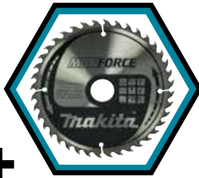
Makforce Handkreissägeblatt 40 Zähne, Art. B-32340